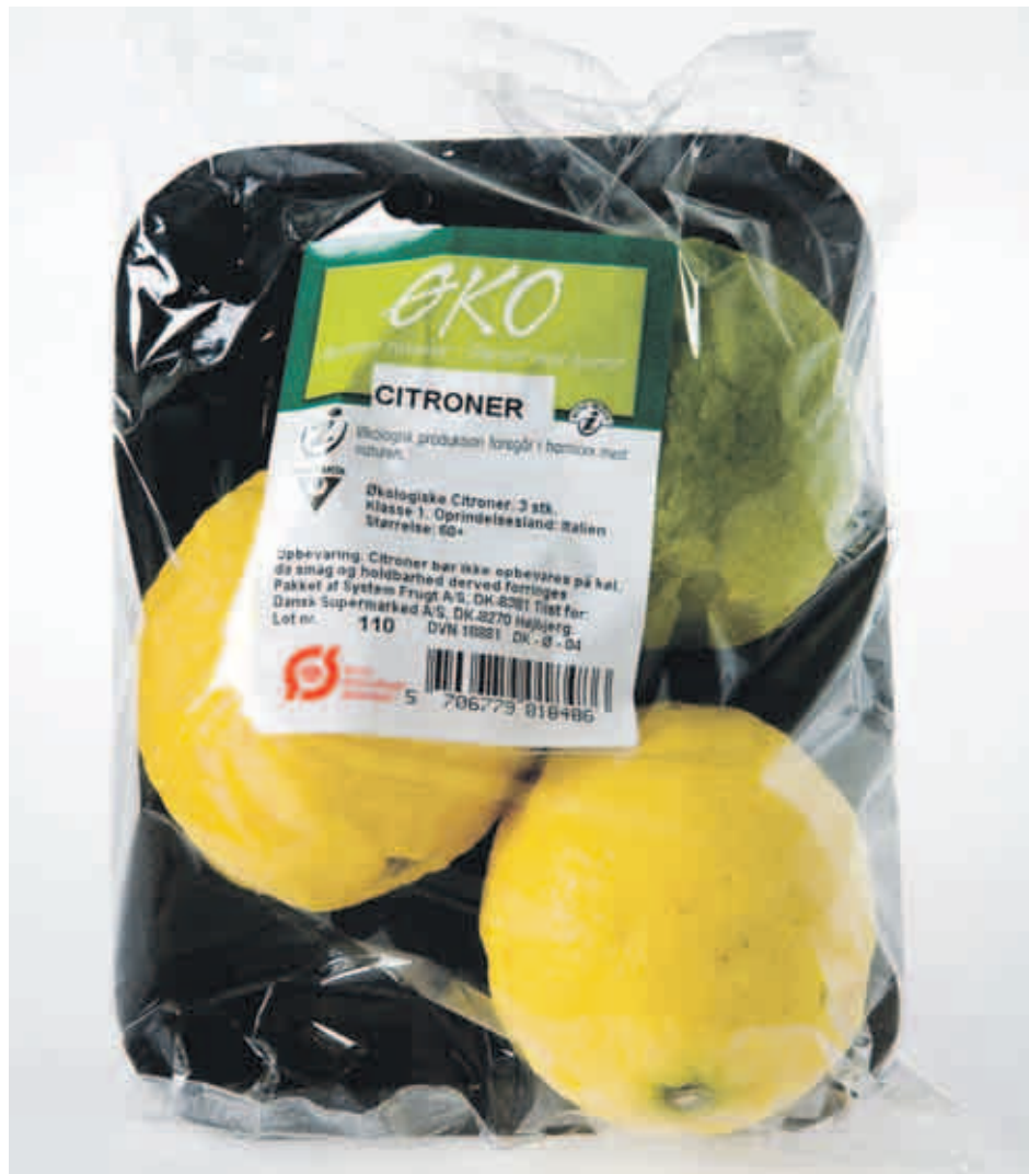
ØKOLOGISK – De økologiske citroner er pakket for sig selv, så de ikke bliver blandet sammen med de ikke-økologiske citroner i supermarkedet. Forbrugerbevægelsen Stop Spild Af Mad peger på, at det giver mere spild, når singler og små husstande således tvinges til at købe flerstyks-pakninger.

Debatindlæg, kommentarer og læserbreve sendes til: Dansk Handelsblad ♦ Fenrisvej 11 ♦ 8230 Åbyhøj